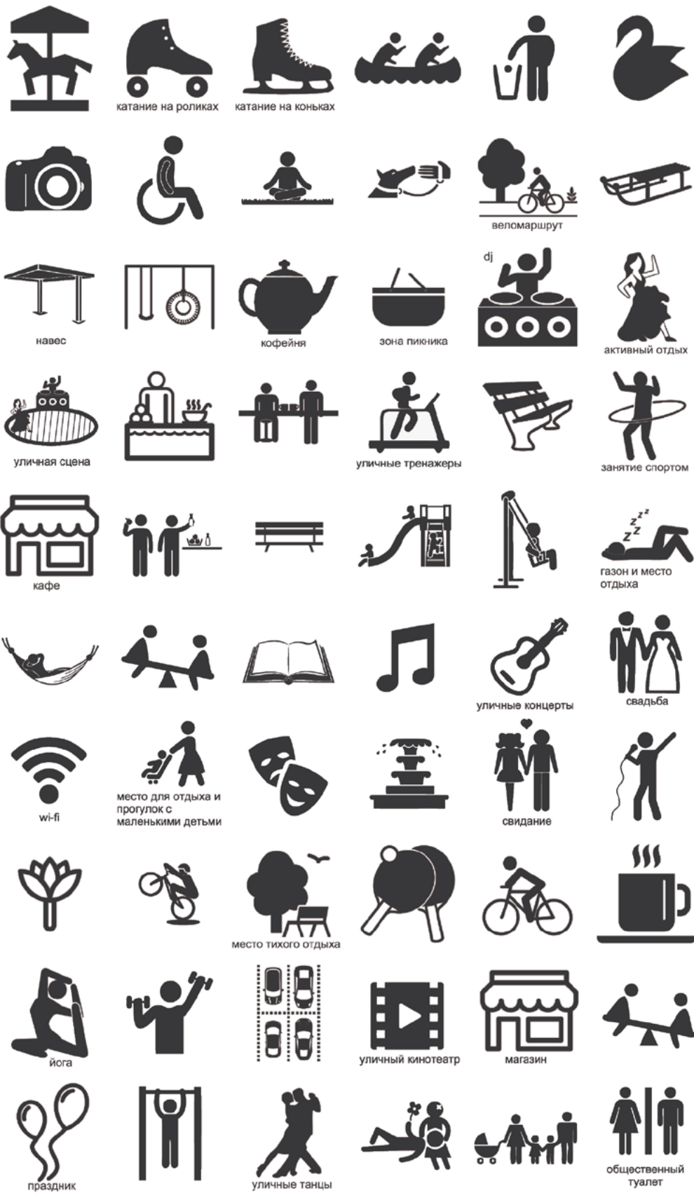
Пример набора значков для проведения дизайн-игры, используемых для работы с картой